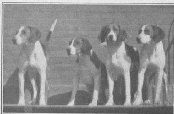
Quelques étalons du chenil de Fleurus.

La chasse la plus curieuse faite par l'équipage jusqu'ici est celle d'un gros broquart attaqué le 21 Janvier 1925 au Pavillon, qui débûche jusqu'à Chambon, revient par Cour-